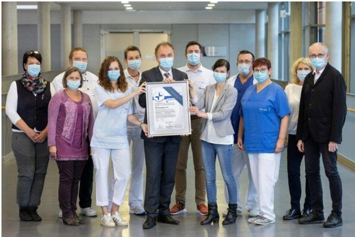
Bild 1. Ein Querschnitt durch das SRH Zentralklinikum Suhl