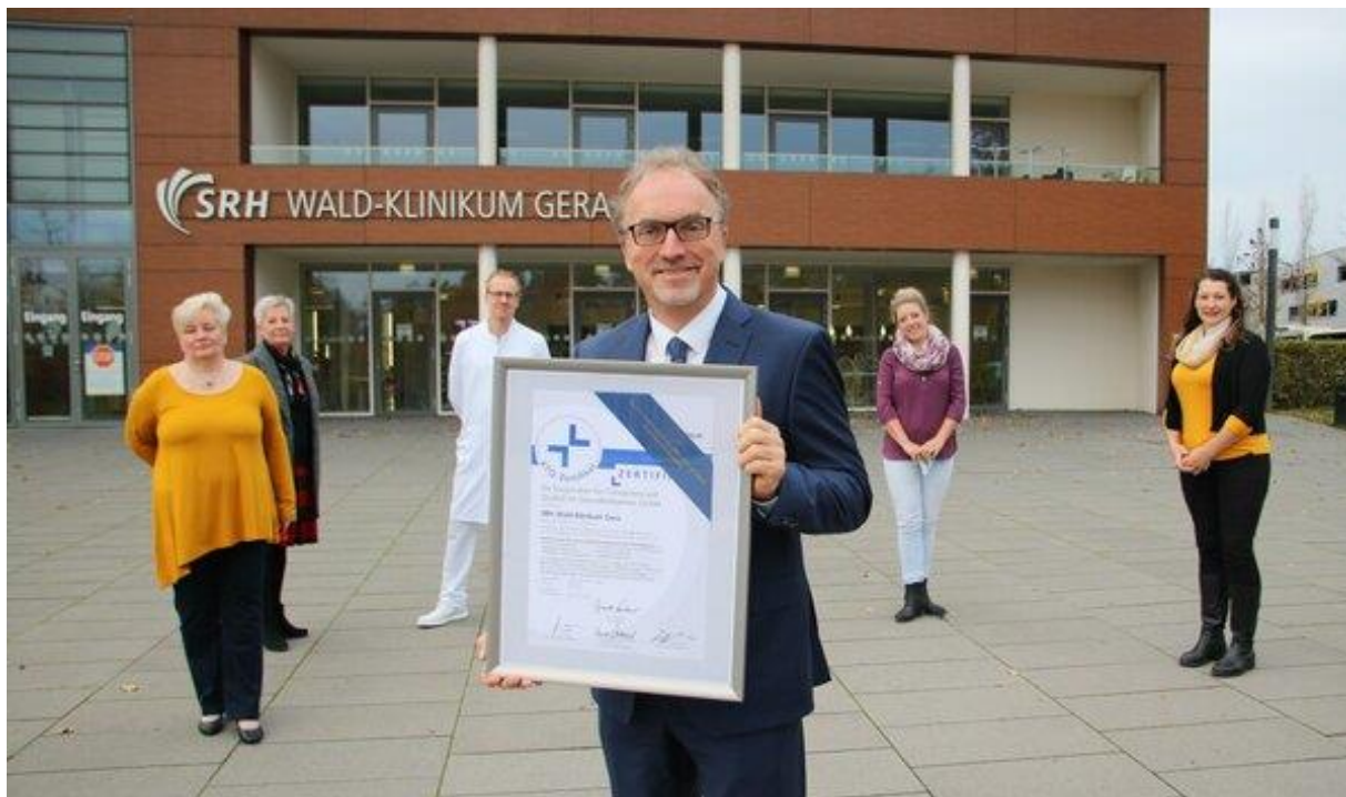
Bild 2. SRH Wald-Klinikum Gera